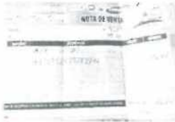
Imagen referencial nota de venta