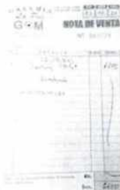
Nota de venta