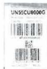
Tag del producto