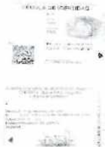
Anverso y reverso de la cedula de identidad

-Para el registro de Tablets, Relojes inteligentes y audifonos se deben subir fotos de documento de venta, el tag del producto cortado y en el registro se debe colocar el número de SERIAL y se debe subir foto del original de la cedula de identidad anverso y reverso.