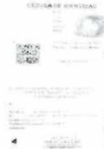
Anverso y reverso de la Cedula de Identidad