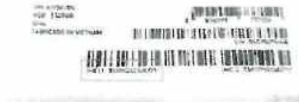
Imagen referencial Tag celular