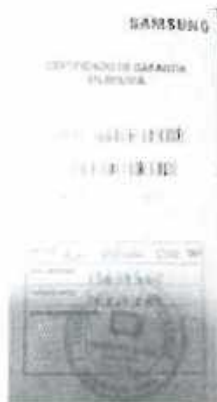
Póliza de garantía