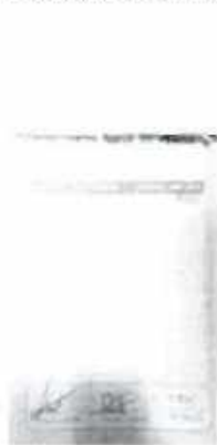
Nota de venta