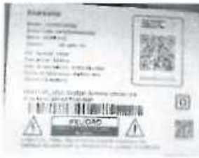
Plaqueta con el serial del producto