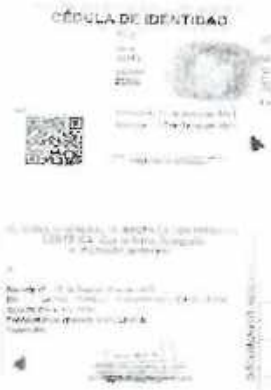
Anverso y reverso de la cedula de Identidad

-Para el registro de Televisores, Monitores, Refrigeradores y/o Lavadoras, el participante debe subir en el registro fotos de documento de venta, la póliza de garantía del producto debidamente llenada a nombre de la persona que está haciendo el registro, el Tag cortado del producto o foto de la placa donde se encuentra el serial del producto, en el registro se debe colocar el número de SERIAL y por último debe subir la foto del original de la cedula de identidad anverso y reverso.